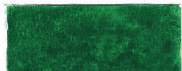
Kromoxydgøn Sine Vadsby 04