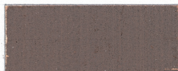
Lys brændt umbra