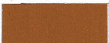
Terra di Siena, rå