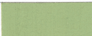
Lys grøn jord