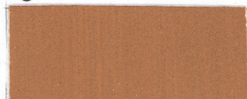
Lys rå siena